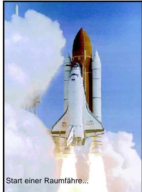
Start einer Raumfähre...